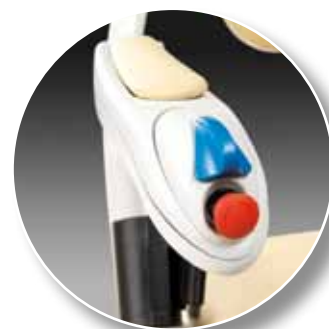
Comandi di bordo