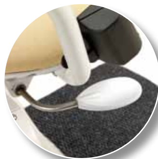
La manovra per la rotazione del sedile è comoda e veloce