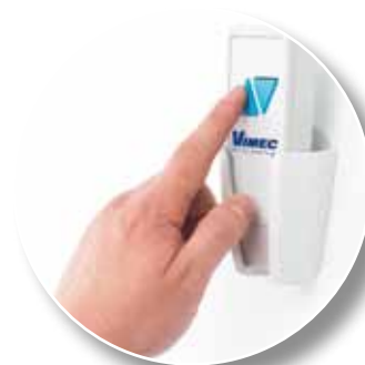
Telecomando di piano